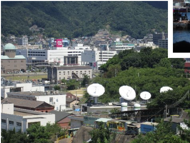
海上自衛隊呉通信隊 IDDN 固定地球局の パラボナアンテナ （安全保障上危険地域：通信施設が最初に 攻撃的となる）